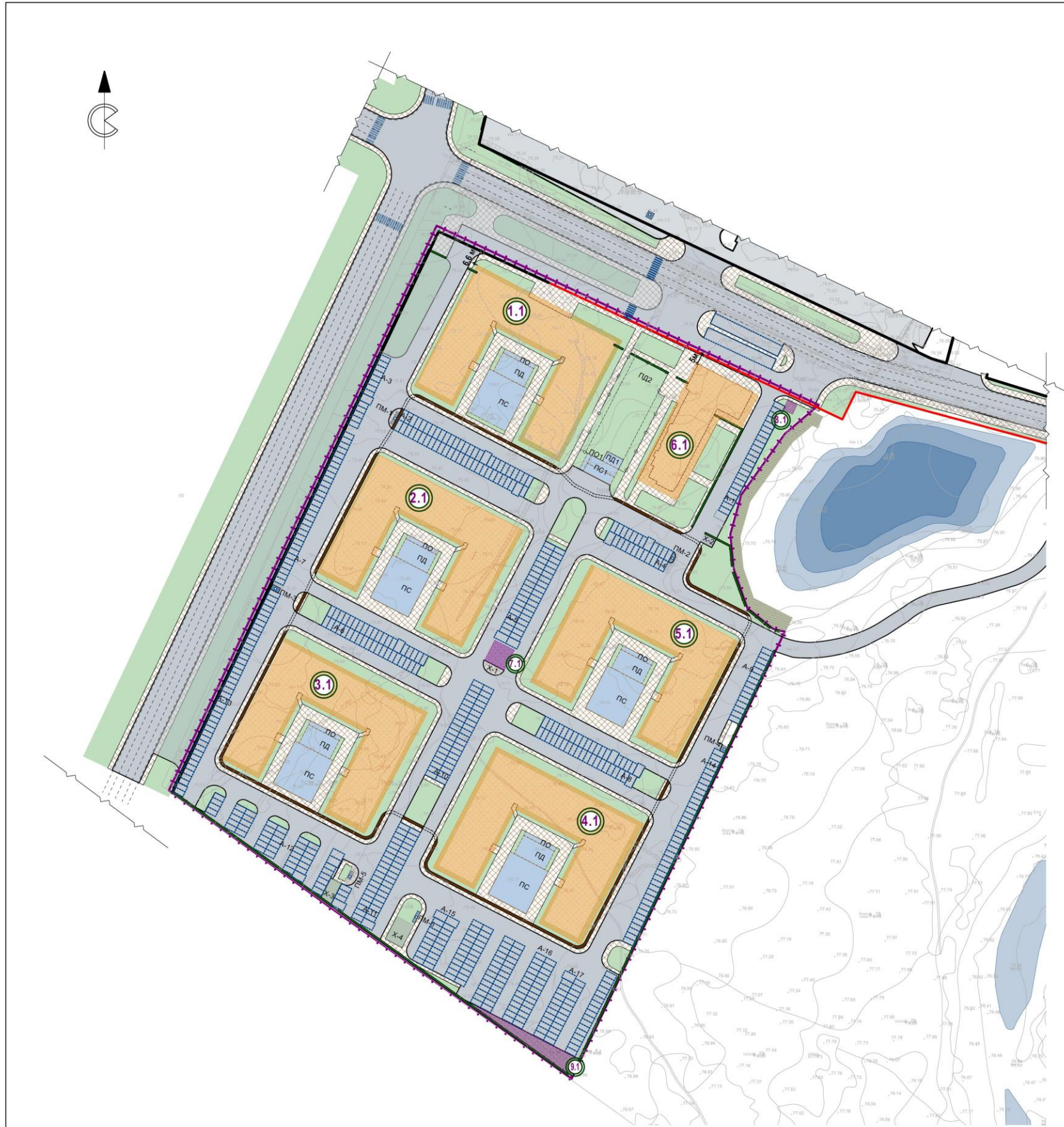
ЭКСПЛИКАЦИЯ ЗОН ПЛАНИРУЕМОГО РАЗМЕЩЕНИЯ ОБЪЕКТОВ КАПИТАЛЬНОГО СТРОИТЕЛЬСТВА